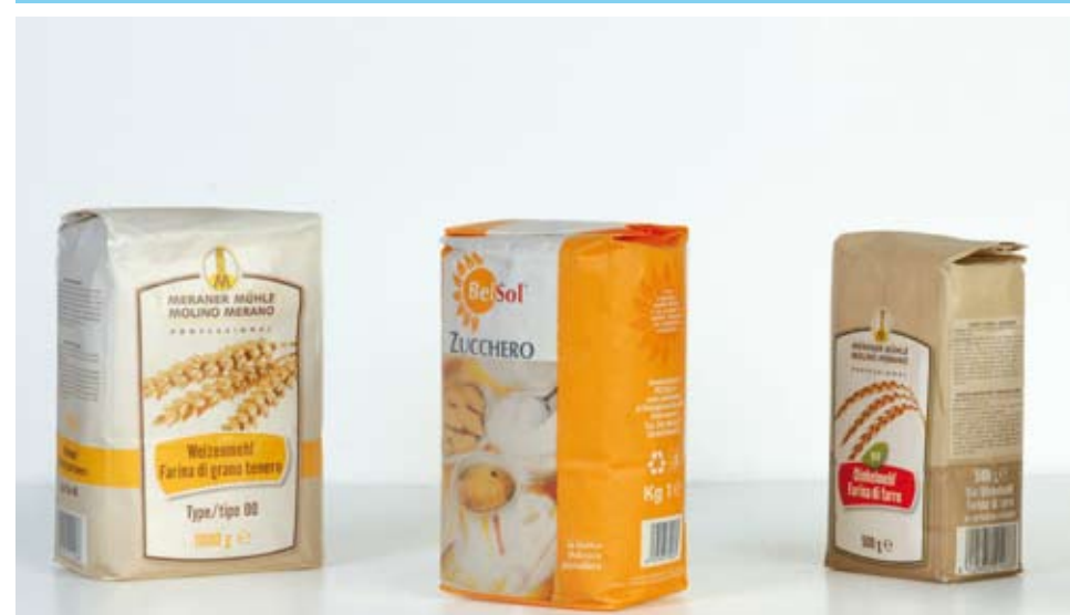
Esempio di sacchetti confezionati dalla macchina Exemple de sacs emballés par machine Example of bags packed by machine