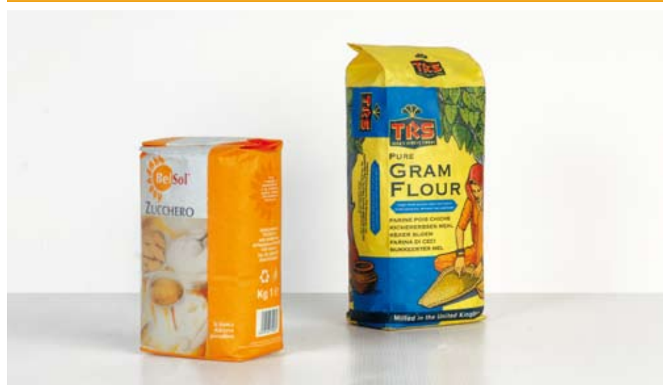
Esempio di sacchetti confezionati dalla macchina Exemple de sacs emballé par machine Example of bags packed by machine